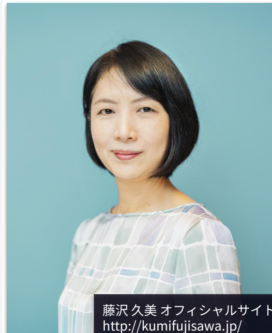
藤沢 久美 オフィシャルサイト http://kumifujisawa.jp/

自らの起業・経営体験を元に、NHK教育テレビ「21世紀ビジネス塾」のキャスターとして、全国の中小企業やベンチャー企業の取材を行った。同時に、様々なテレビ・ラジオ・雑誌等を通じて、1000社を超える企業を取材。現在も、全国の元気な企業の経営者のインタビューと現場の取材を続け、メディアを通じて発信している。